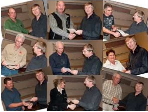
Other award winners at the show